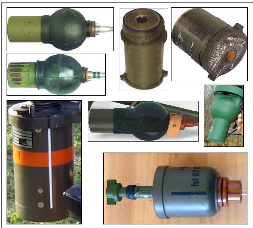
POIGNÉES DE TIR et UNITÉS DE LANCEMENT