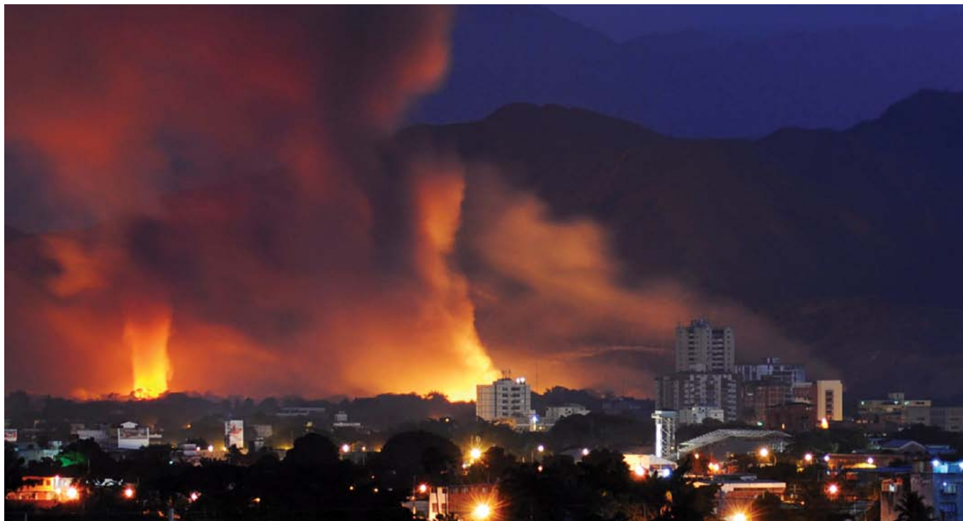
Poročali so, da je požar povzročil eksplozijo skladišča topniškega streliva venezuelske vojske in terjal eno smrtno žrtev ter evakuacijo 10.000 prebivalcev z okoliških območij. Maracay, Venezuela. Januar 2011.

jejo PSSM. 9 Mednarodni donatorji, ki delujejo bilateralno, ali prek regionalnih organizacij, so številnim vladam pomagali uničiti presežne zaloge streliva in vzpostaviti ustrezne pogoje skladiščenja preostalih zalog. 10